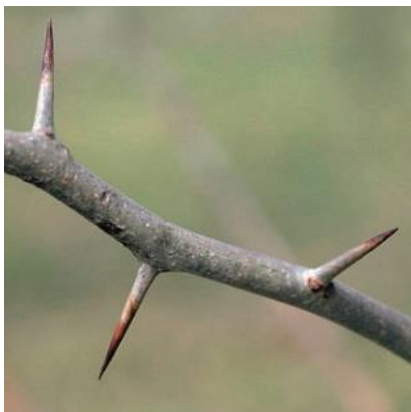
Osagedorn - Stacheldraht

2) Die folgenden Bilder mit Beschriftung braucht ihr nicht mit übernehmen. Diese dienen ausschließlich der Visualisierung für euch.